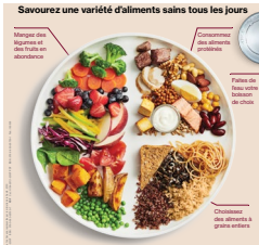
Image : L'assiette « Bien manger » du Guide alimentaire canadien (Santé Canada, 2019)

Utilisez l'assiette « Bien manger » du Guide alimentaire canadien pour planifier tous les repas et collations. Rappelez-vous qu'il n'est pas nécessaire que les repas et les collations ressemblent exactement à l'assiette « Bien manger » pour être considérés comme sains.