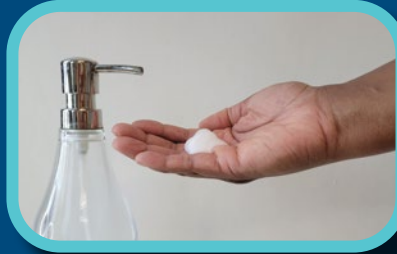
Étape 2: Appliquer le savon liquide