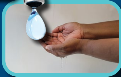
Étape 1: Mouiller les mains