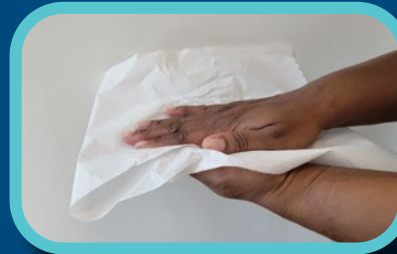
Étape 5: Essuyer avec serviette de papier ou utiliser un sèche-mains