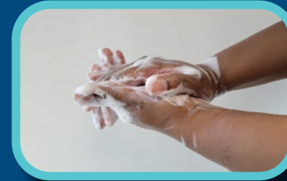
Étape 3: Nettoyer l'arrière des mains, entre les doigts, les pouces et autour des ongles pendant 20 secondes