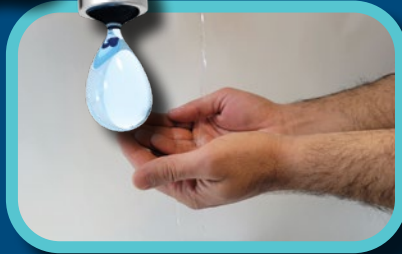
Étape 1: Mouiller les mains