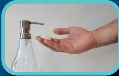
Étape 2: Appliquer le savon liquide