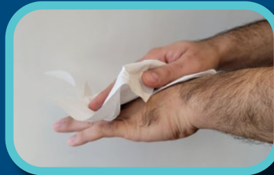
Étape 5: Essuyer avec serviette de papier ou utiliser un sèche-mains