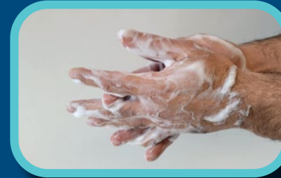
Étape 3: Nettoyer l'arrière des mains, entre les doigts, les pouces et autour des ongles pendant 20 secondes