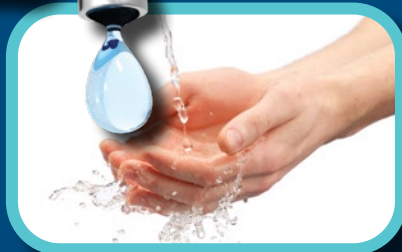
Étape 1: Mouiller les mains