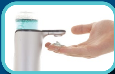
Étape 2: Appliquer le savon liquide