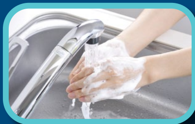
Étape 4: Bien rincer