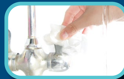
Étape 6: Si possible, fermer le robinet avec une serviette

Rappelez-vous que, bien se laver les mains enlève des microbes qui peuvent vous rendre malade!