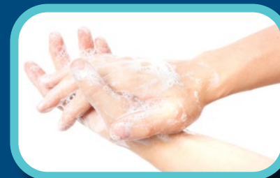
Étape 3: Nettoyer l'arrière des mains, entre les doigts, les pouces et autour des ongles pendant 20 secondes